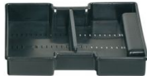
KIT TRAY MUB